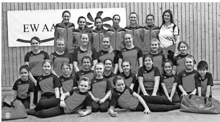
Bild: Die erfolgreichen Kunst- und Einradsporthler des Jahres 2018 gewinnen erneut den BDR-Gold-Pokal, als Zeichen des erfolgreichsten Hallenradsporthvereins in Deutschland. Es ist ein kleines Jubiläum, denn es ist der 20. Gold-Pokal-Sieg für den RMSV Aach

Deutschen Schülermeisterschaften übergeben, die im Juni im fränkischen Ebersdorf (bei Coburg) stattfinden wird. Bereits zum 20. Mal werden die Aacher Kunst- und Einradsporthler vom BDR zu Deutschlands erfolgreichster Hallenradsporthverein gekürt, denn nach 1987, 1990, 1991, 1997, 1998, 1999, 2000, 2002, 2003, 2004, 2005, 2006, 2007, 2008, 2010, 2011, 2012, 2015 und 2017 wird der Gold-Pokal 2018 einen Platz im Aacher Trophäenschrank finden.